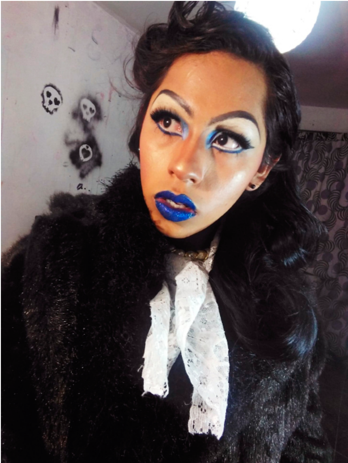
Villana de telenovela , Yul Figueroa. México, 16 de junio de 2017.